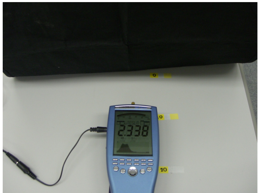
電磁波シールドを挿入